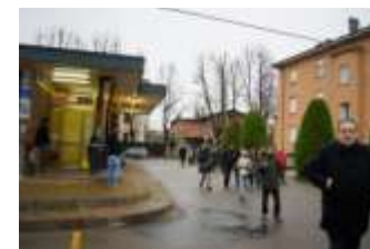
Luogo di socialità e di relazioni dove si mescolano nuovi e vecchi abitanti. Già previsto lo spostamento nella nuova area delle Ex cantine sociali.