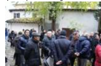
Giardini, spazi interclusi, piccoli edifici, passaggi da riqualificare per realizzare un nuovo "anello" pedonale.